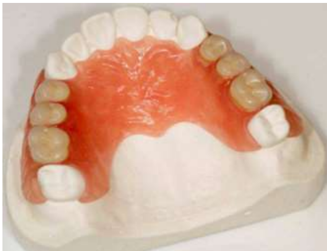
Figura 2 – Prótese Parcial Removível Flexível