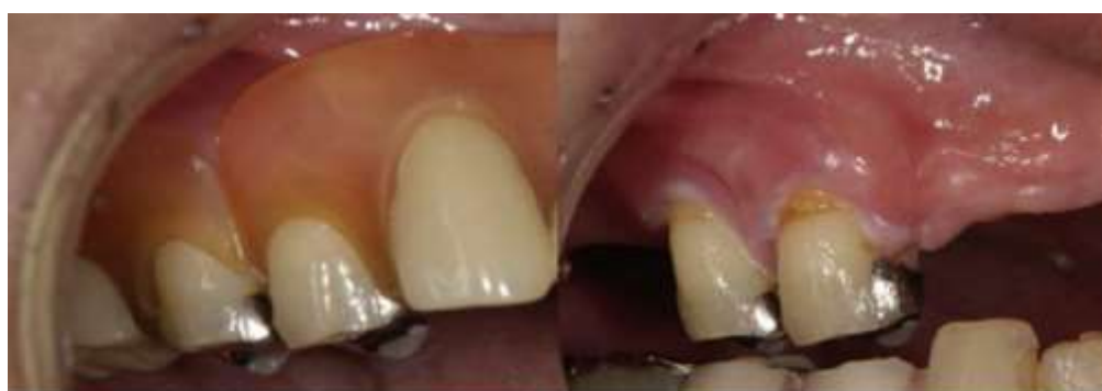
Figura 4 – PPRFlex com ausência de estrutura metálica, compressão e inflamação da margem gengival devido a transferência ineficaz das forças oclusais

As implicações clínicas desses desenhos distintos são amplas. Estudos, como o de Costa (2016) e Hemmati et al. (2015), examinaram o impacto das propriedades mecânicas na capacidade mastigatória, concluindo que as PPRFlex demonstraram menor eficácia em alimentos mais duros devido à sua flexibilidade, assim como observaram deslocamentos leves dos dentes artificiais durante a mastigação intensa, potencialmente resultando em sobrecarga no rebordo alveolar, contradizendo assim os princípios convencionais no qual as próteses parciais removíveis são baseadas.