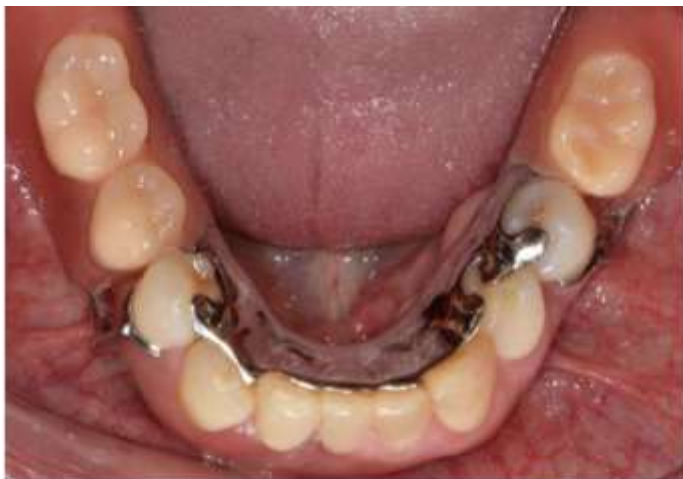
Figura 1 – Prótese Parcial Removível a Grampo