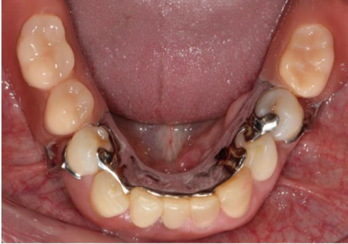
Figura 1 – Prótese Parcial Removível a Grampo