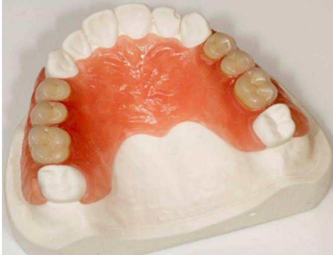
Figura 2 – Prótese Parcial Removível Flexível