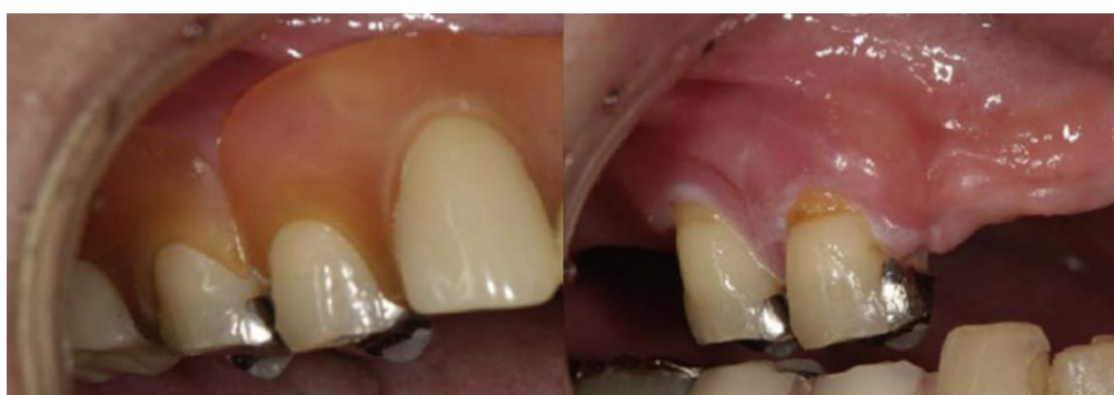
Figura 4 – PPRFlex com ausência de estrutura metálica, compressão e inflamação da margem gengival devido a transferência ineficaz das forças oclusais

As implicações clínicas desses desenhos distintos são amplas. Estudos, como o de Costa (2016) e Hemmati et al. (2015), examinaram o impacto das propriedades mecânicas na capacidade mastigatória, concluindo que as PPRFlex demonstraram menor eficácia em alimentos mais duros devido à sua flexibilidade, assim como observaram deslocamentos leves dos dentes artificiais durante a mastigação intensa, potencialmente resultando em sobrecarga no rebordo alveolar, contradizendo assim os princípios convencionais no qual as próteses parciais removíveis são baseadas.