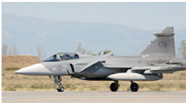
Figura 2 – Gripen