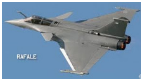
Figura 1 – Aeronave Rafale