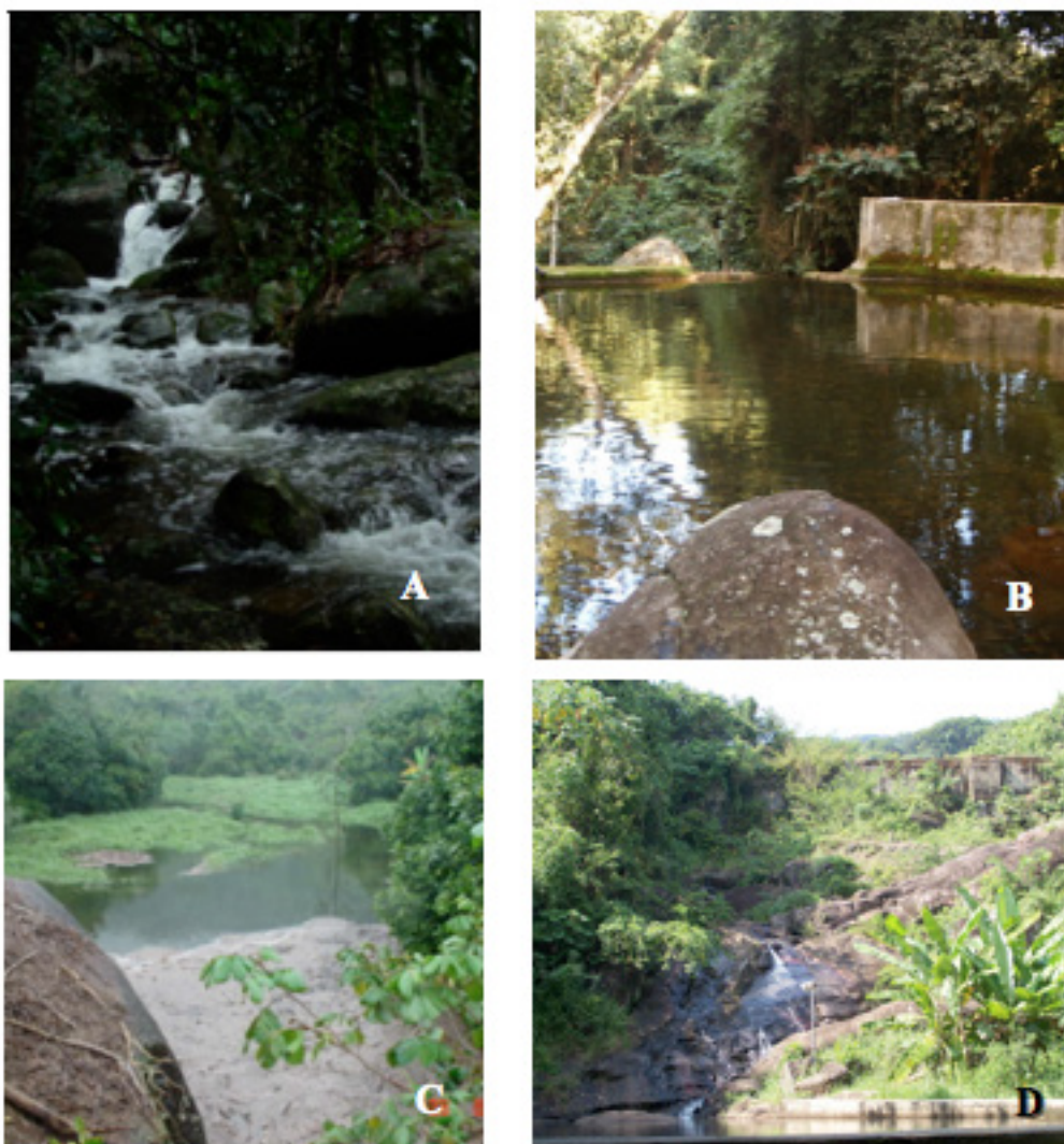
Figura 2 – Rio Marambaia: A. Ponto 1: Gruta da Santa; B Ponto 2: Área do Projettino; C. Ponto 3: Pedra Grande; D. Ponto 4: Praça das Armas.

As coletas duraram quatro dias, sendo que em cada dia era explorado um ponto. Em cada ponto, o esforço de coleta foi de quatro horas, com a utilização de quatro métodos: manual, Amostrador Súber, rede D (rapichê) e peneira (Figura 3A-D).