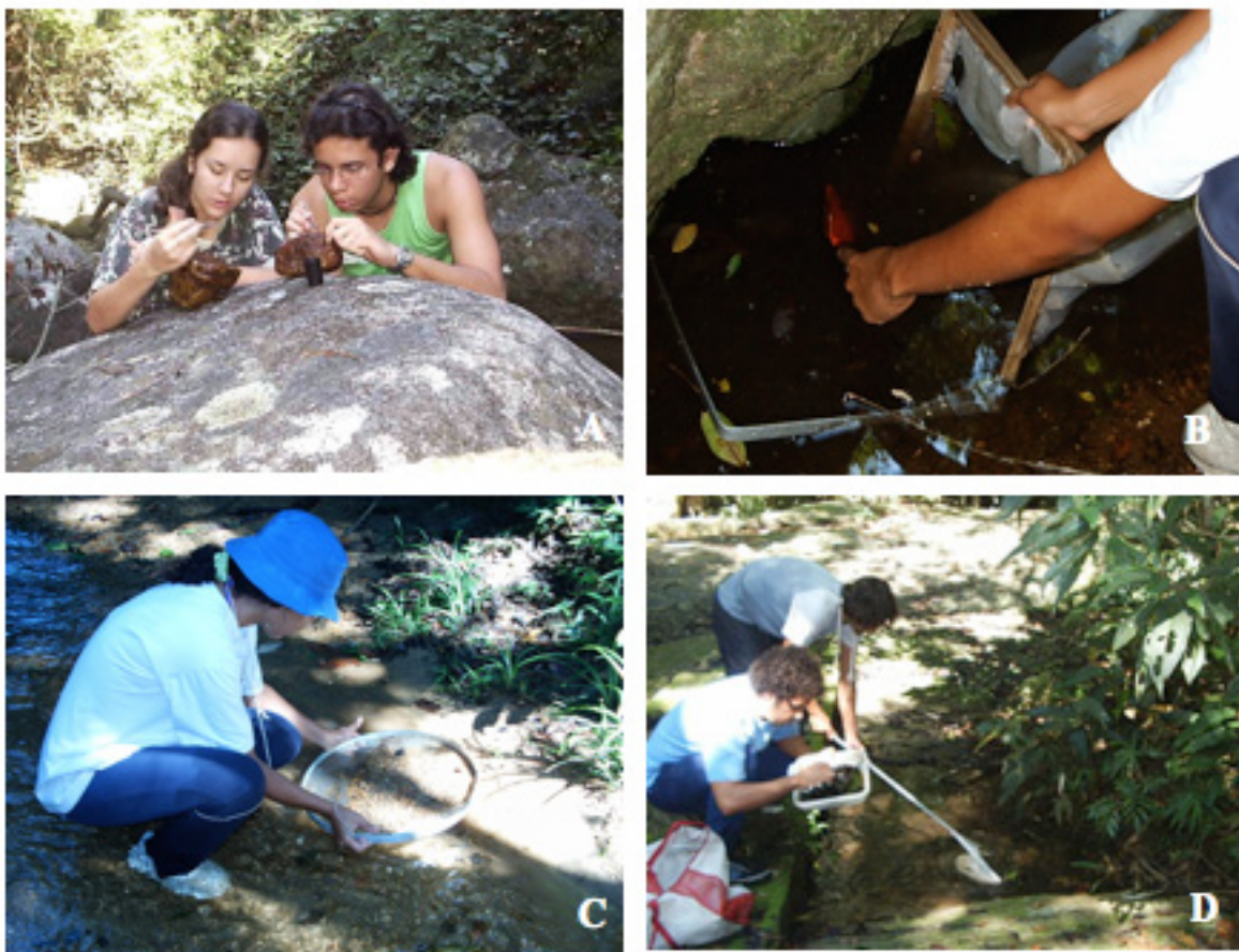
Figura 3 - Métodos de Coleta: A - Coleta Manual, B – Súber, C – Peneira e D - Rapiché.